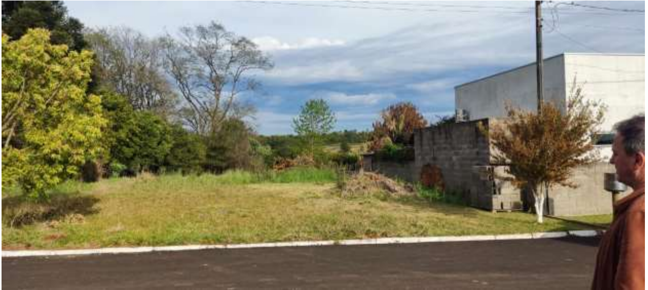
FOTO LOTE 09 QUADRA 1585